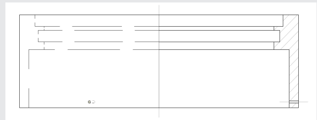
Für verriegelbare Abdeckung